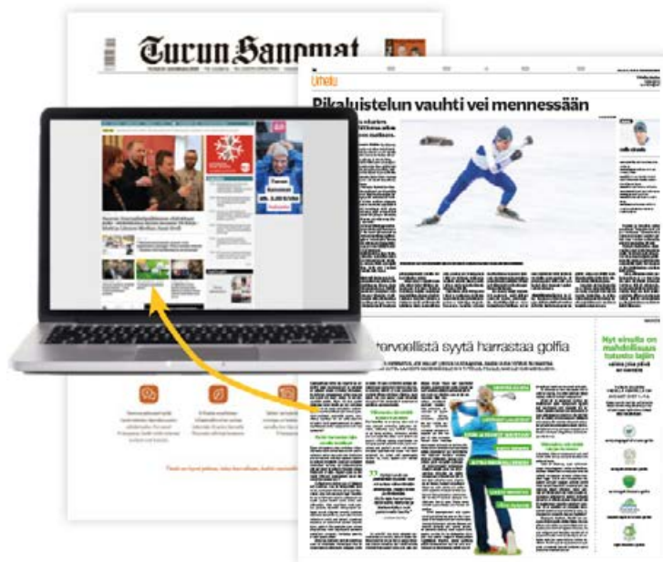
Päälehti (broadsheet) ja ts.fi

Printin advertoriaalin ja verkon natiivi-artikkelin yhdistelmällä saavutat laajan näkyvyyden ja tavoitat potentiaaliset asiakkaasi monikanavaisella ratkaisulla.