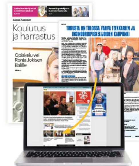
Teemalehti (tabloid) ja ts.fi

Sisältää tekstin tuottamisen, kuvat ja uutisoston ts.fi:ssä viikon ajan. Myös videosisältöä voidaan julkaista. Tarjoamme tuotannon tarvittaessa erikseen noin 500–1000 €/video.