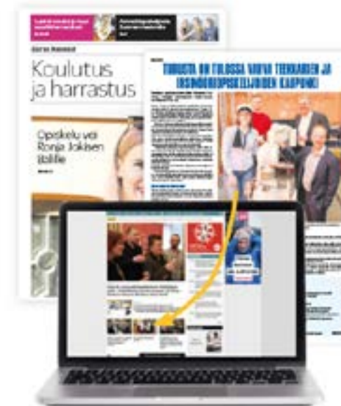
Teemalehti (tabloid) ja ts.fi

Sisältää tekstin tuottamisen, kuvat ja uutisoston ts.fi:ssä viikon ajan. Myös videosisältöä voidaan julkaista. Tarjoamme tuotannon tarvittaessa erikseen noin 500–1000 €/video.