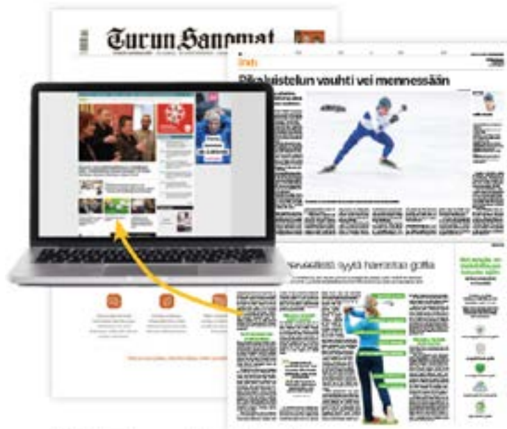
Päälehti (broadsheet) ja ts.fi

Printin advertoriaalin ja verkon natiivi-artikkelin yhdistelmällä saavutat laajan näkyvyyden ja tavoitat potentiaaliset asiakkaasi monikanavaisella ratkaisulla.