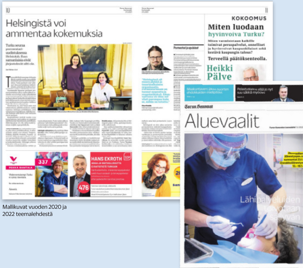
Mallikuvat vuoden 2020 ja 2022 teemalehdestä